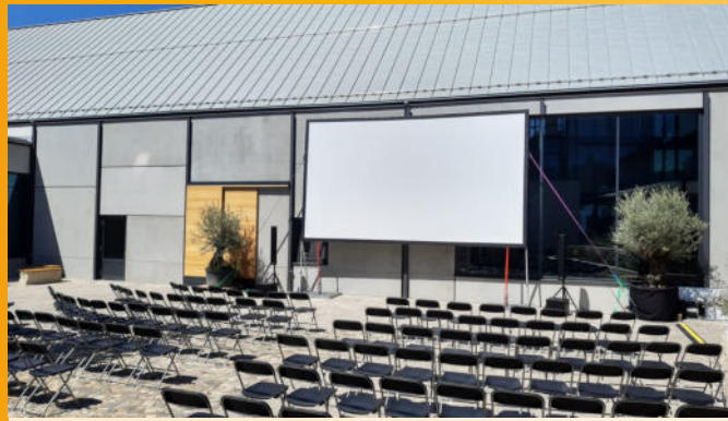
Die Open-Air-Termine 2025, Filme und weitere Hinweise auf unserer Homepage

Themenabend "Integration" am 08.05.2025 um 19.00 Uhr Film und Programm wird rechtzeitig bekannt gegeben! (www.kino-muellheim.de)